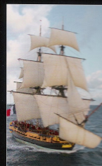
L'ODYSSÉE DE L'HERMIONE

CES MERVEILLEUX POUS VOLANTS NAISSANCE DE L'AVIATION