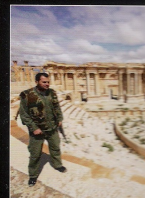
DANS LE CHAOS SYRIEN